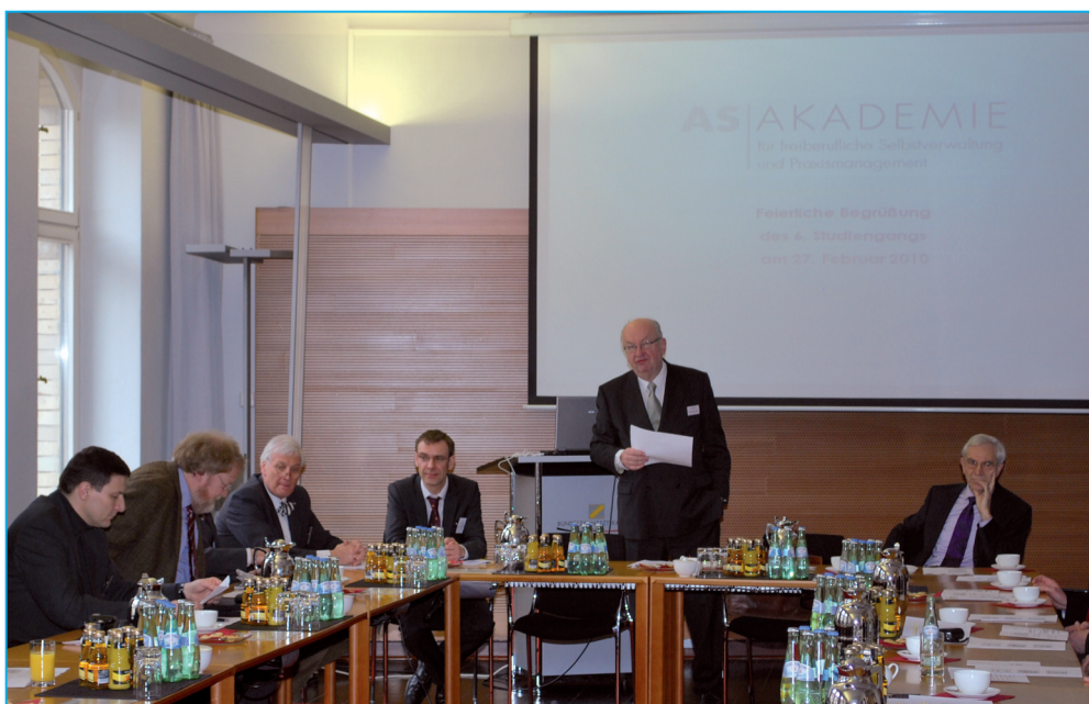
Veranstaltung der AS-Akademie zum Start des 6. Jahrgangs im Haus der BZÄK Ende Februar 2010

„BWL-Fitness für die erste Niederlassung“ (vier Fortbildungspunkte), 19. Mai 2010, 15 bis 18.30 Uhr in den Räumen der KZV Westfalen-Lippe in Münster. Informationen und Anmeldung über die Service GmbH der KZV WL oder über die Internetseite von KlapdorKollegen unter www.klapdor-dental.de .