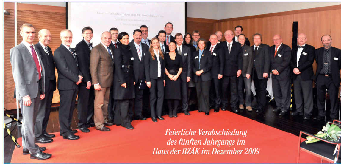
Feierliche Verabschiedung des fünften Jahrgangs im Haus der BZÄK im Dezember 2009

Das Studienprogramm umfasst neben einer Einführung in die rechtlichen Grundlagen wie Sozial- und Verwaltungsrecht, die Volkswirtschaftslehre, Sozialmedizin, Berufsethik und Geschichte der Zahnheilkunde auch politikwissenschaftliche Fragen wie die Rolle der Verbände in der Politik und den Ablauf von Gesetzgebungsverfahren, auch über den deutschen „Tellerrand“ hinaus unter Einbeziehung der europäischen Gesundheits- und Sozialpolitik. Einen breiten Teil nehmen natürlich die Grundlagen des Gesundheitswesens ein, so die Frage, wie gesetzliche Kranken-